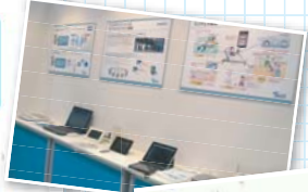
国際展示会でインタビューされています!