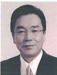
■パネリスト 釘宮 馨 (くぎみや ばん) / 大分市長

第28回香川菟池寛賞受賞、まちづくりプロデューサー、総合遊活動「るいまま組」主宰、ユニセフ香川イメージソング「わ・は・は」作詞、むれ石あかり月あかりライブ総合プロデュース、むれ源まちづくり協議会テーマソング「風のおい」作詞、さぬき落語「ぬめるとー」原作制作、たかまつ松平藩『まちかど漫遊帖』総合プロデュース、まちかど漫遊帖公式イメージソング「まつとのマーチ」制作。